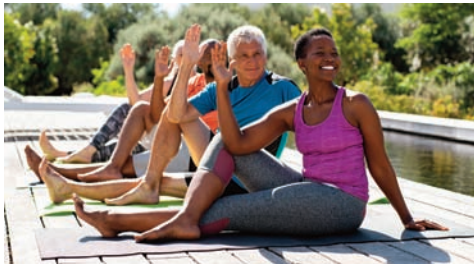
Yoga o Tai Chi