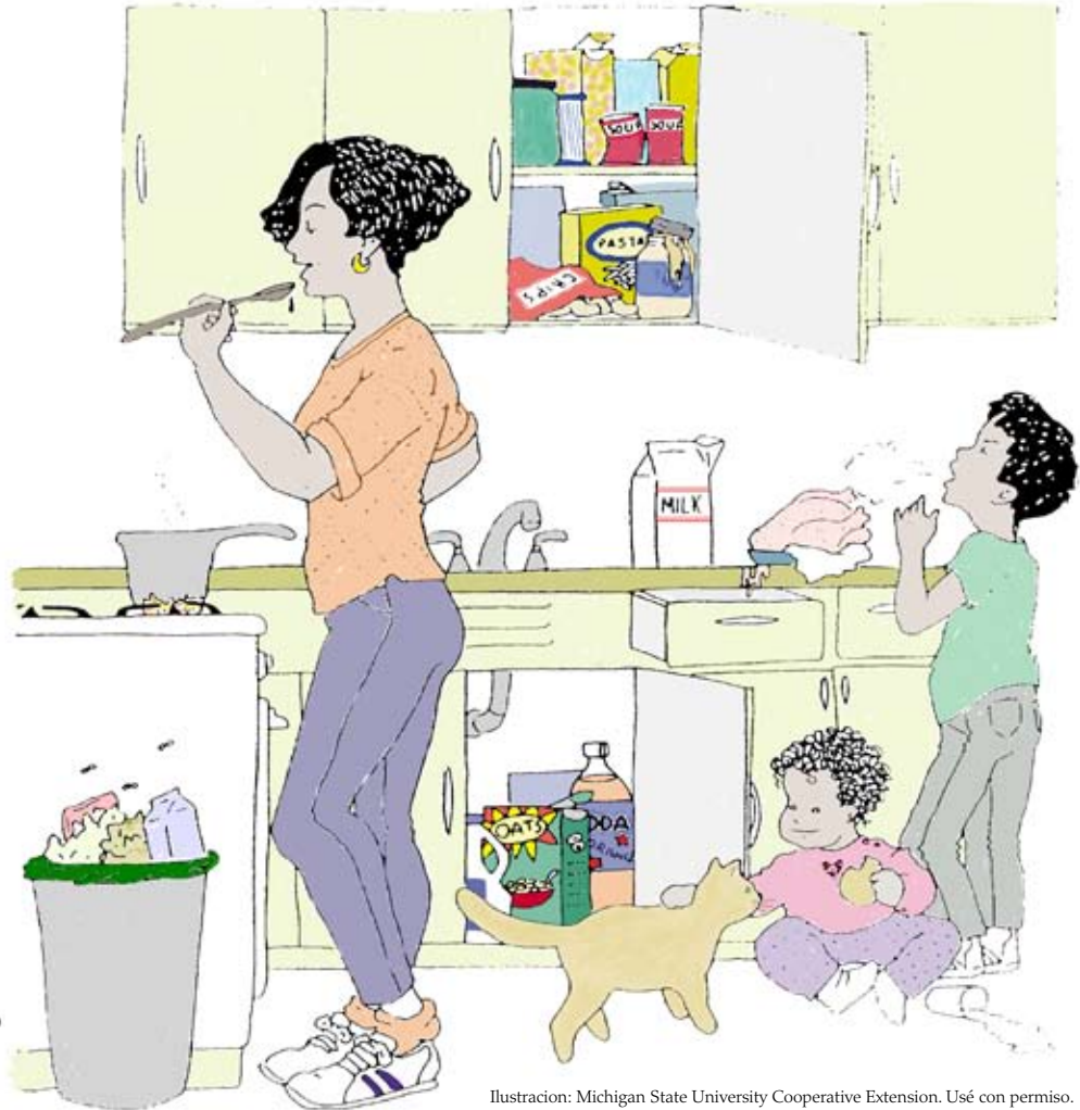
Ilustración: Michigan State University Cooperative Extension. Usé con permiso.